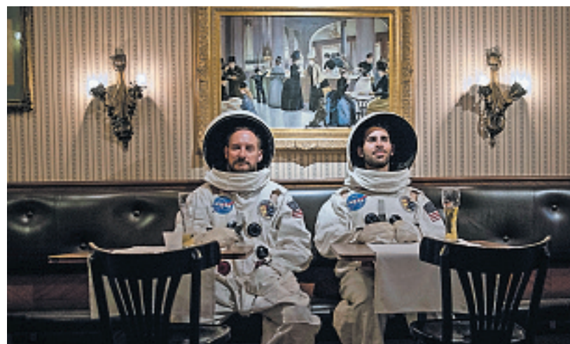
«Die Astronauten» kurbeln das Kopfkino so richtig gehörig an.